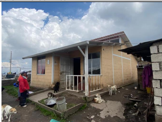
Imagen No. 1: Vista general del frente del predio No. 3669037.