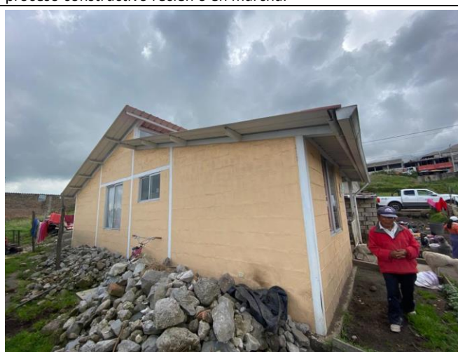
Imagen No. 4: Vista de fachada lateral. No se constata ningún proceso constructivo recién o en marcha.