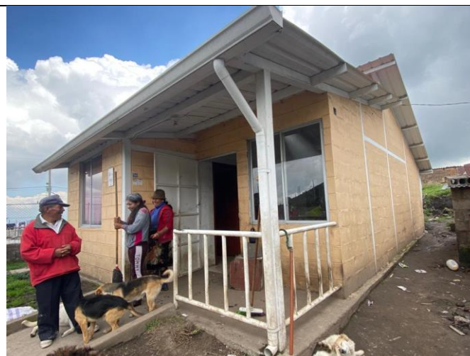
Imagen No. 3: Vista de fachada lateral y frontal. No se constata ningún proceso constructivo recién o en marcha.