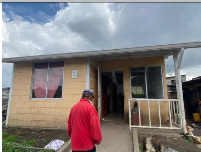
Imagen No. 2: Vista de fachada frontal. No se constata ningún proceso constructivo recién o en marcha.