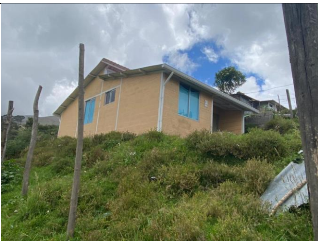
Imagen No. 3: Vista de fachada lateral. No se constata ningún proceso constructivo recién o en marcha.