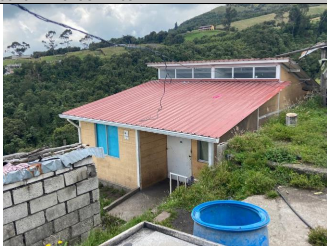
Imagen No. 1: Vista general del frente del predio No. 3618873.