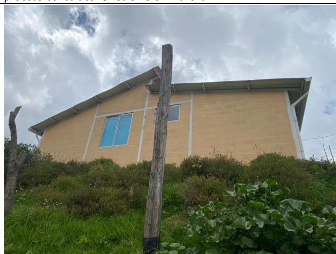
Imagen No. 4: Vista de fachada lateral. No se constata ningún proceso constructivo recién o en marcha.