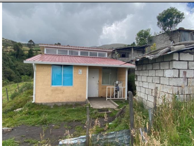
Imagen No. 2: Vista de fachada frontal. No se constata ningún proceso constructivo recién o en marcha.